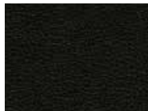
029.033 Schwarz Midnight black