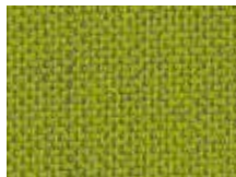
118.011 Hellgrün Vivid green