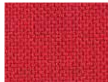
118.041 Feuerrot Züco red