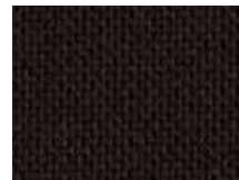
118.033 Schwarz Midnight black