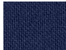
118.022 Dunkelblau Deep blue