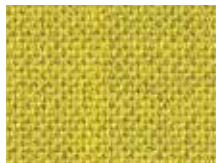
118.002 Limonengelb Lime yellow

Zusammensetzung: 85% Wolle, 8% Polyamid, 4% Lycra, 3% Polyester ca. 420g/m Gewicht: ca. 420g/m Breite: 140cm Lichtechtheit: Note 5–7 (DIN EN ISO 105-B02) Reibechtheit: nass: 3–4 / trocken: 4–5 (DIN EN ISO 105-X12) Scheuerfestigkeit: 70.000 Touren (Martindale; DIN EN ISO 12947) Brandverhalten: DIN EN 1021: Teil 1/2 Composition: 85% Wool, 8% Polyamide, 4% Lycra, 3% Polyester Weight: approx. 420g/m Width: 140cm Light fastness: value 5–7 (DIN EN ISO 105-BO2) Fastness to rubbing: wet: 3–4 / dry: 4–5 (DIN EN ISO 105-X12) Abrasion resistance: 70,000 rubs (Martindale; DIN EN ISO 12947) Flammability: DIN EN 1021: Part 1/2