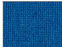
118.019 Indigoblau Indigo blue