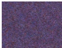
163.024 Lila Lila