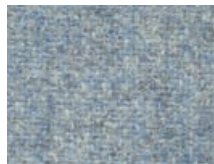
163.025 Wasserblau Lagoon blue