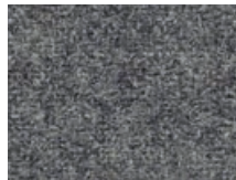
163.036 Anthrazitgrau Asphalt grey