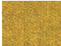
163.004 Currygelb Curry yellow