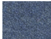
163.121 Stahlblau Steel blue