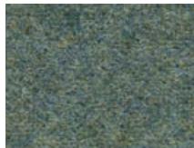
163.011 Hellgrün Vivid green