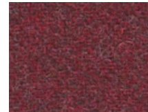
163.048 Shirazrot Shiraz red