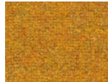
163.044 Orange Orange