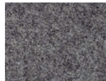
166.036 Anthrazitgrau Asphalt grey