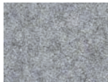
166.030 Grau Metal grey