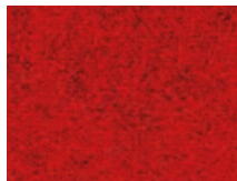
166.040 Chilliroth Chilli red

Composition: Pure New Wool Weight: 580 g/m Width: 150 cm Light fastness: value 6 (EN ISO 105-B02) Abrasion resistance: 35.000 rubs (Martindale; EN ISO 12947)