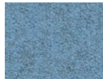
166.025 Wasserblau Lagoon blue