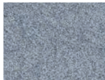
166.121 Stahlblau Steel blue