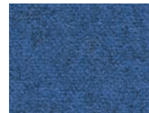
166.019 Indigoblau Indigo blue