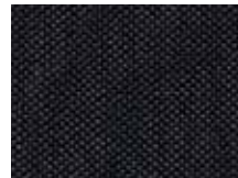
011.033 Schwarz Midnight black