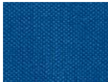
011.019 Indigoblau Indigo blue