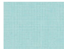
168.016 Wassergrün Ice green