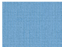
168.120 Hellblau Light blue