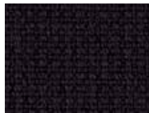
078.033 Schwarz Midnight black