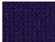
078.022 Dunkelblau Deep blue