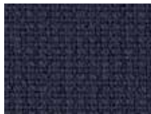
078.036 Anthrazitgrau Asphalt grey