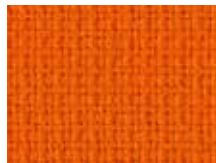
078.044 Orange Orange