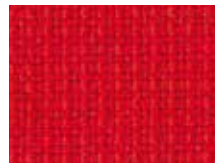
078.041 Feuerrot Züco red