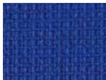
078.027 Königsblau Royal blue