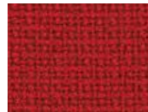
078.040 Chillirost Chilli red