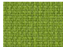
078.010 Grün Organic green