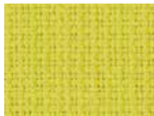
078.002 Limonengelb Lime yellow