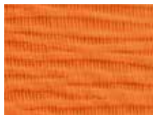
063.044 Orange Orange

Abrasion resistance: 100,000 rubs (Martindale) Flammability: DIN EN 1021: Part 1/2 *Polyamide hybrid fibres are extremely durable and therefore resistant to the effects of abrasion. Lightweight and fine, they offer high elasticity, guaranteed dimensional stability and dry quickly. Only for X-Code (seat without wave structure).