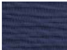
063.022 Dunkelblau Deep blue