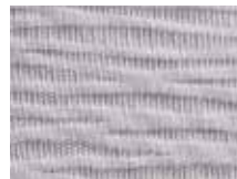
063.031 Platingrau Platin