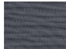
063.035 Graphitgrau Graphite