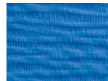
063.019 Indigoblau Indigo blue